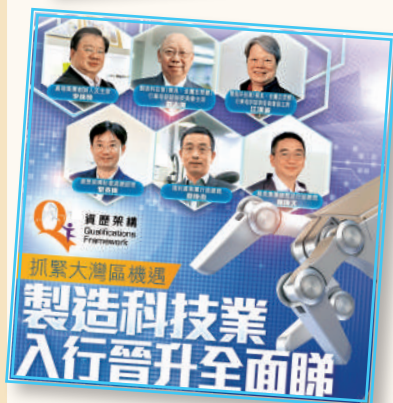
▲ 製造科技業「入行晉升全面睇」 宣傳活動 (2019年8月)