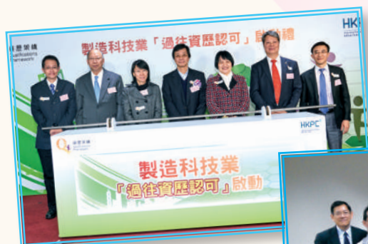
◀ 製造科技業「過往資歷認可」啟動禮 (2017年3月)