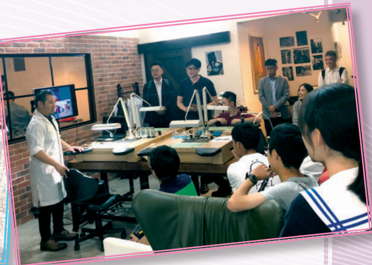
▲ 獲獎者與中學生分享經驗