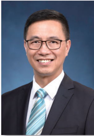
教育局局長 楊潤雄先生, JP