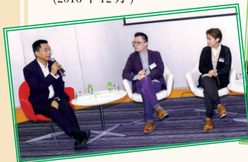
▲ 舉辦「把握商貿形勢 升級管理人才」 研討會 (2019年11月)