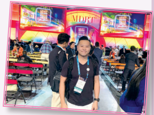
▲ 獲獎者參與美國百萬圓桌年會