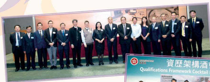
▲ 檢測及認證業《能力標準說明》 業界諮詢會 (2013 年 11 月)