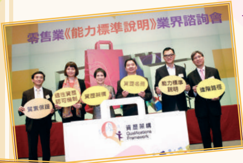
◀ 零售業《能力標準說明》諮詢簡介會 (2013年6月)