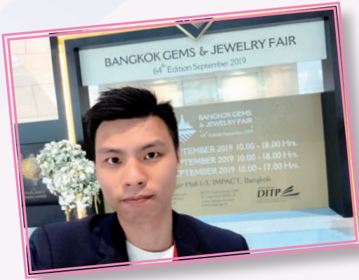
▲ 獲獎者參與曼谷寶石及珠寶展