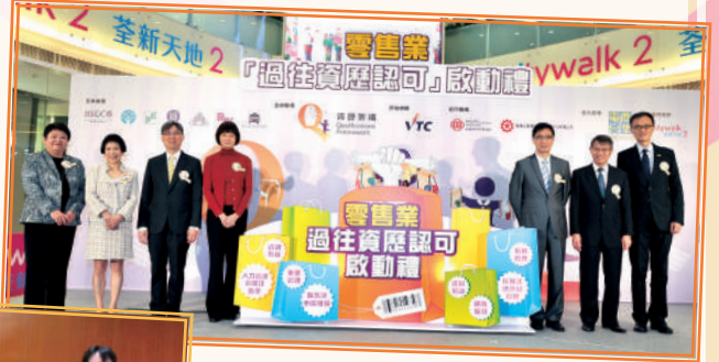
▲ 零售業「過往資歷認可」啟動禮 (2014年11月)