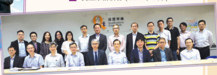
▲ 現屆檢測及認證業諮委會 (2020 年)