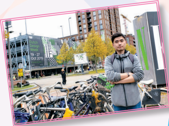
▲ 獲獎者參與荷蘭設計周