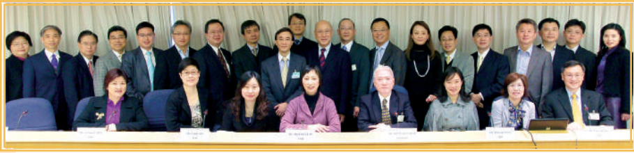
▲ 第一屆保險業諮委會 (2011 年)