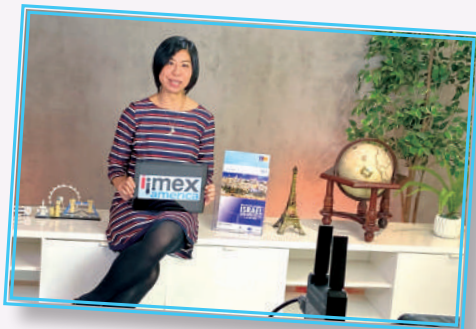
▲ 不同行業的獲獎者參與拍攝「學習體驗獎勵計劃」宣傳短片