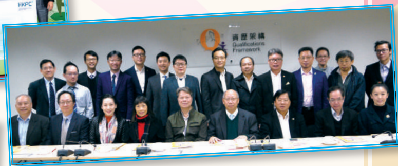
▲ 上屆製造科技業諮委會 (2018年)