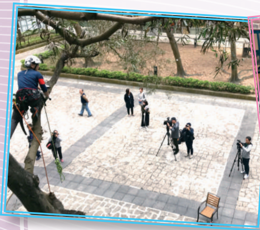
▲ 獲獎者向傳媒示範攀樹