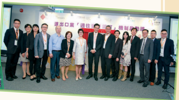
▲ 進出口業「過往資歷認可」啟動禮 (2015年9月)