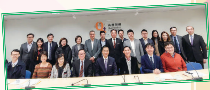
▲ 現屆進出口業諮委會 (2019年)