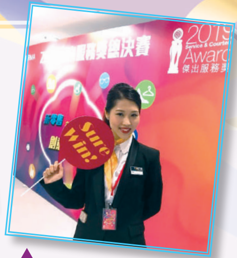
▲ 獲獎者參與香港零售管理協會傑出服務獎並獲得零售大使獎