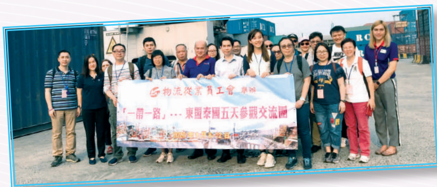
▲ 獲獎者參與東盟泰國交流團