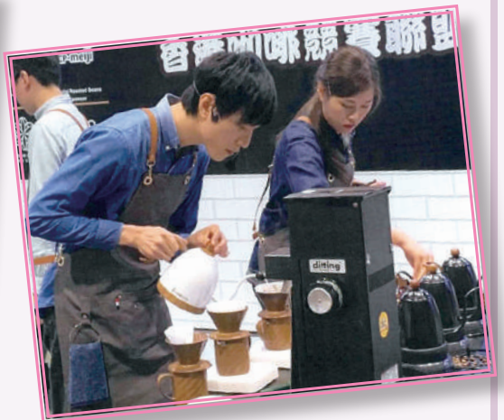
▲ 獲獎者參與 Coffee Power Rangers Championship 團隊咖啡比賽