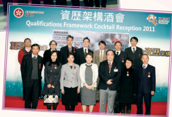
▲ 資歷架構酒會 (2011 年 1 月)