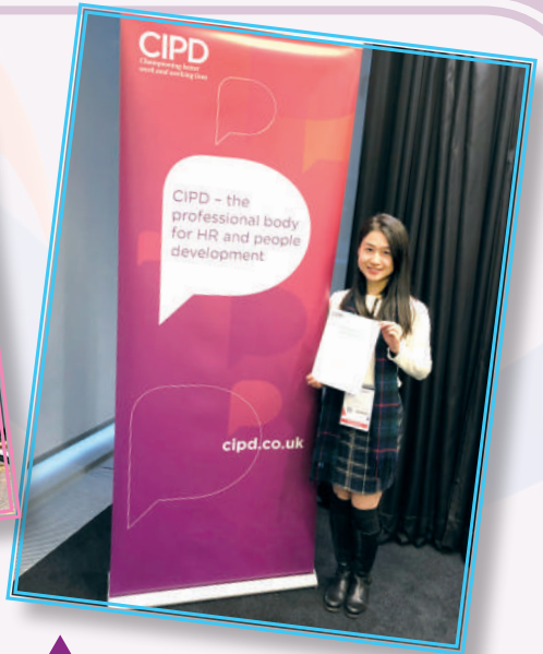
▲ 獲獎者參與英國人力發展研討會