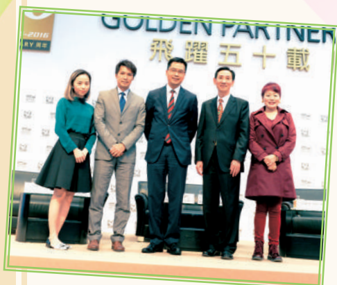
▲ 於中小企博覽舉行資歷架構講座 (2016年12月)