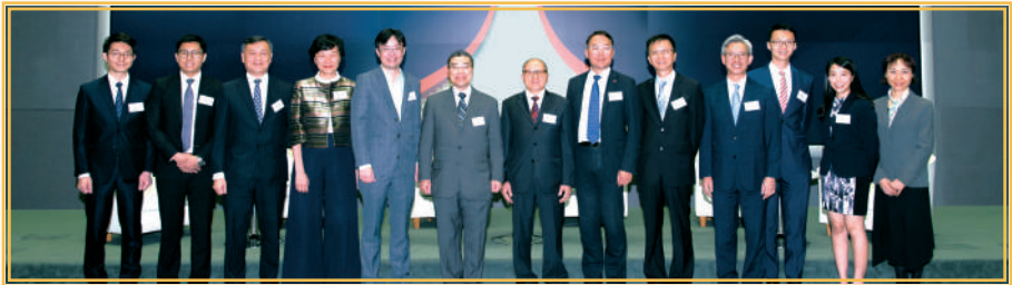
▲ 保險業與銀行業合辦資歷架構「建立成功事業」講座 (2018 年 12 月)