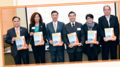
▲ 保險業資歷架構研討會 (2016 年 3 月)