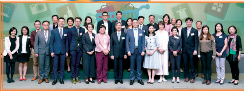
▲ 零售業「過往資歷認可」嘉許典禮暨分享會 (2018年11月)