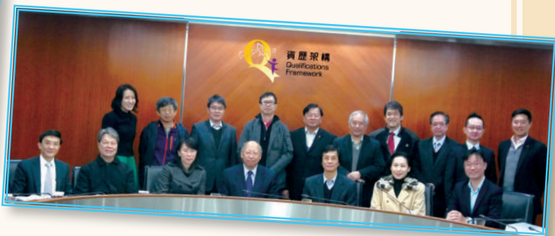
▲ 第三屆製造科技業諮委會 (2016年)