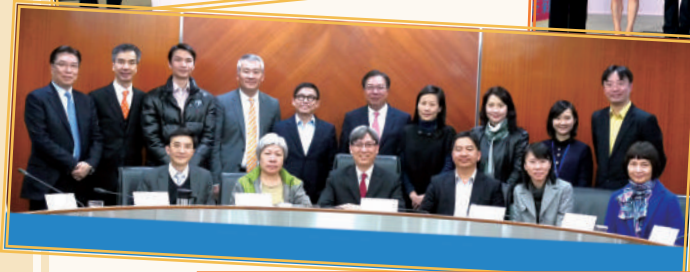
◀ 第三屆零售業諮委會 (2015年3月)