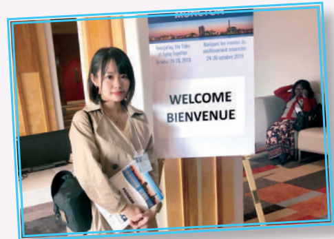
▲ 獲獎者參與加拿大國際安老研討會