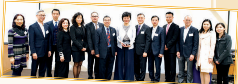
▲ 「職業資歷階梯」業界諮詢簡介會 (2020 年 1 月)