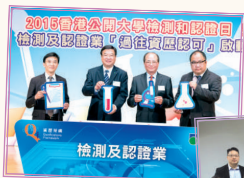
▲ 檢測及認證業「過往資歷認可」 啟動禮 (2015 年 11 月)