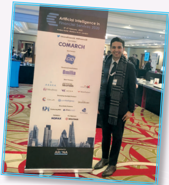
▲ 獲獎者參與倫敦人工智能會議