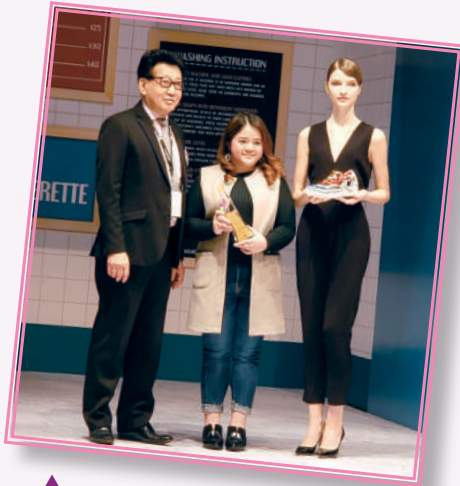
▲ 獲獎者參與第 18 屆香港鞋款設計比賽並獲金獎